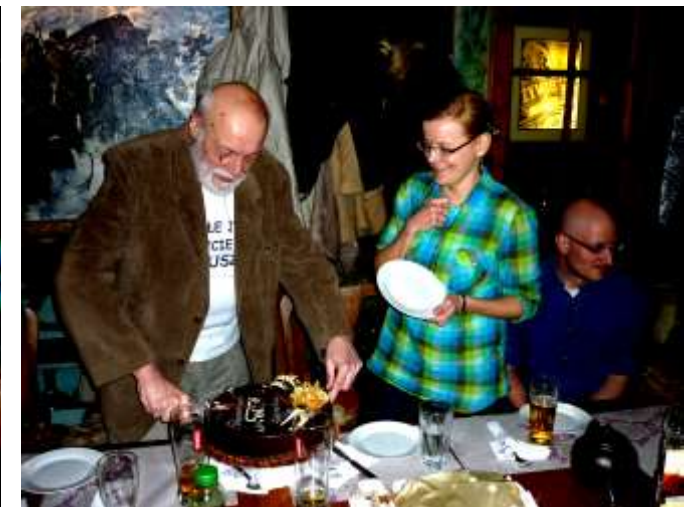
ale pokroić trzeba