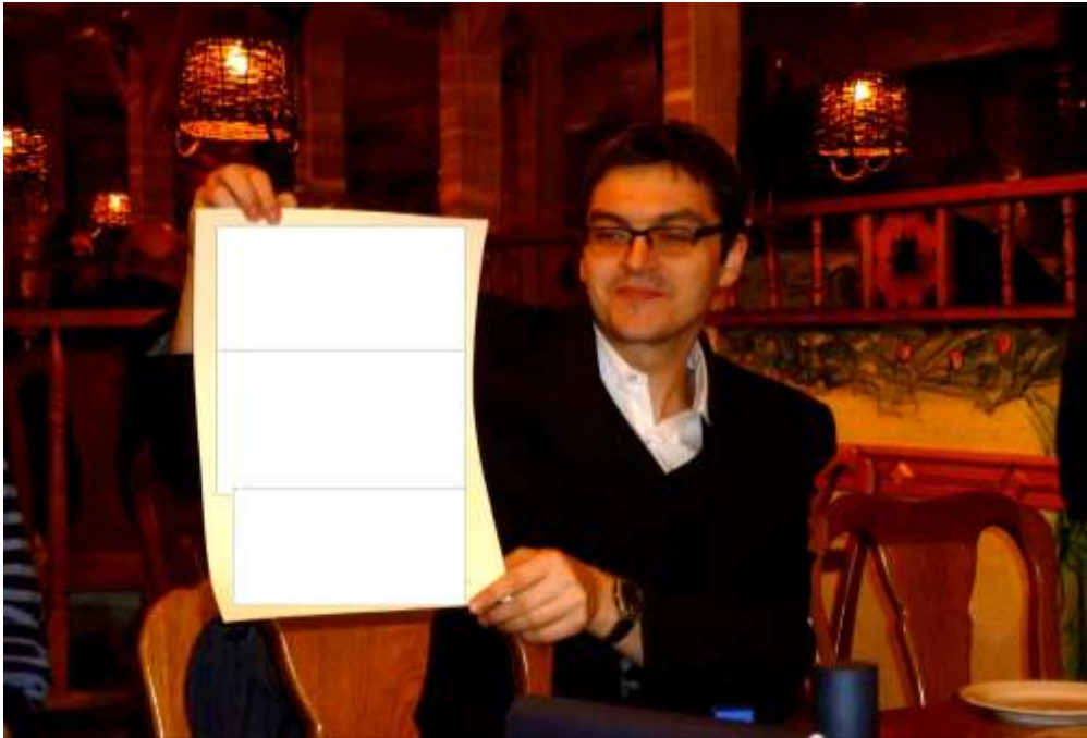
spóźniony z usprawiedliwieniem (tu utajnionym)