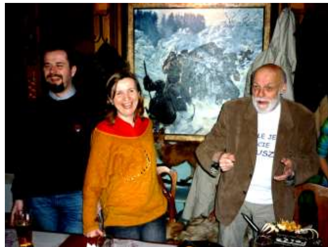
chyba się ośmieszyłem...