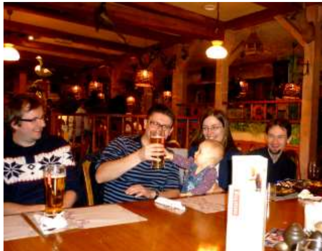
ale zdrowie najważniejsze