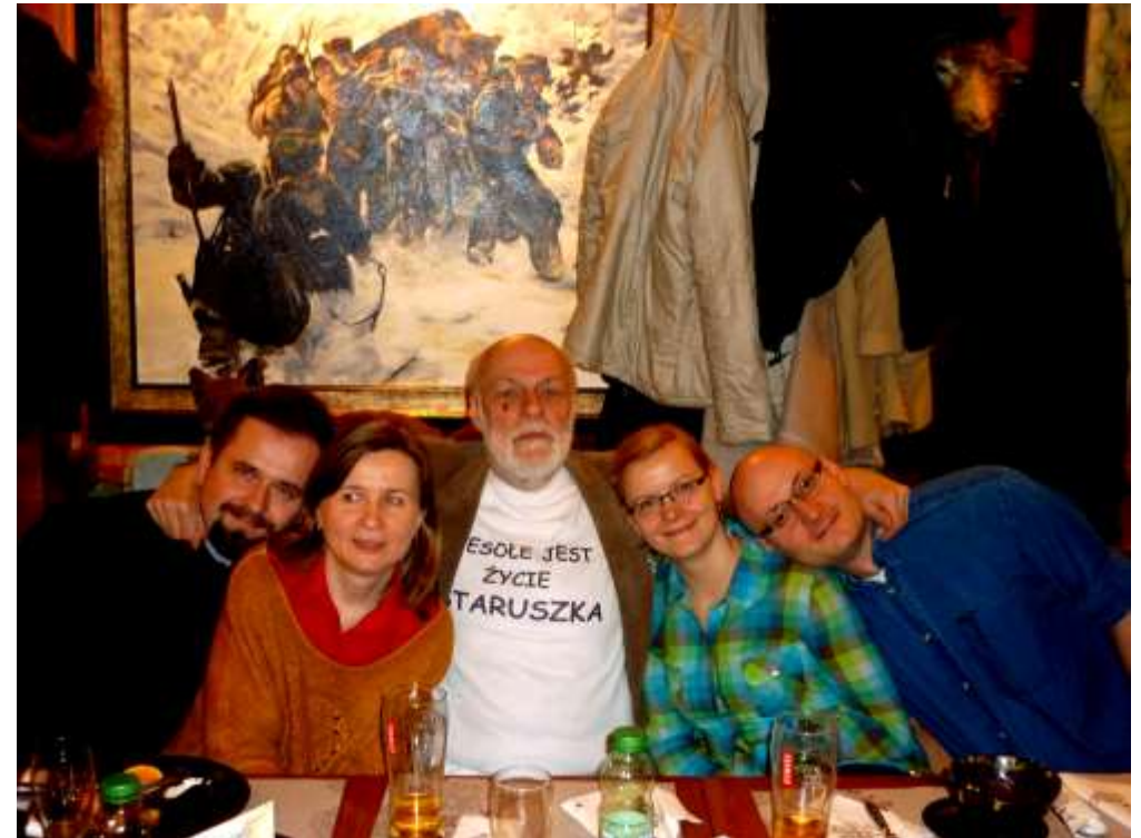
i nie tylko staruszka