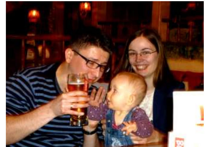
młodzież też ceni zdrowie