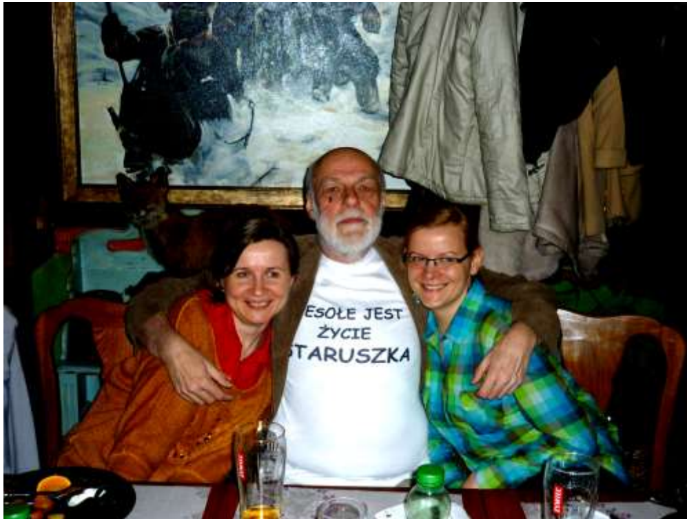
wesołe jest życie staruszka...