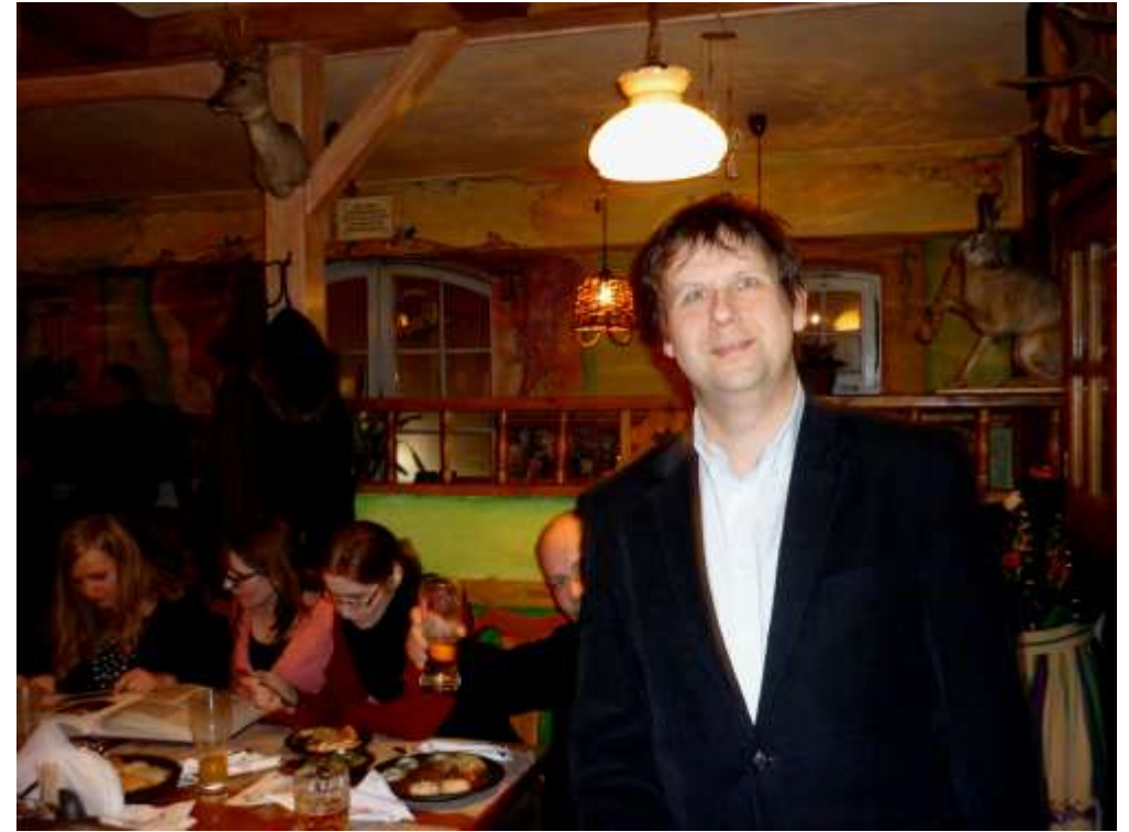
jeden z dziesięciu