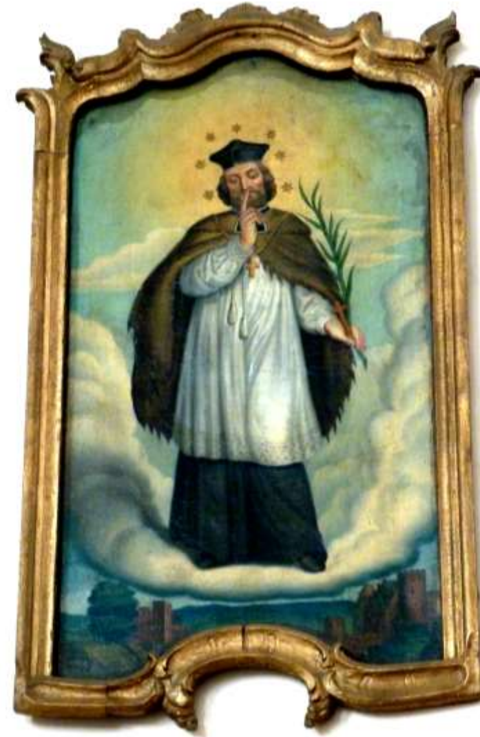
Kościół neogotycki z 1898. Obraz Jana Nepomucena (przełom XVIII/XIX wieku) wisi na przedniej ścianie nawy, na prawo od głównego ołtarza. Prawdopodobnie pochodzi z drewnianej kaplicy Jana Nepomucena, stojącej obok starego drewnianego kościoła, która spłonęła wraz z kościołem w połowie XIX wieku.