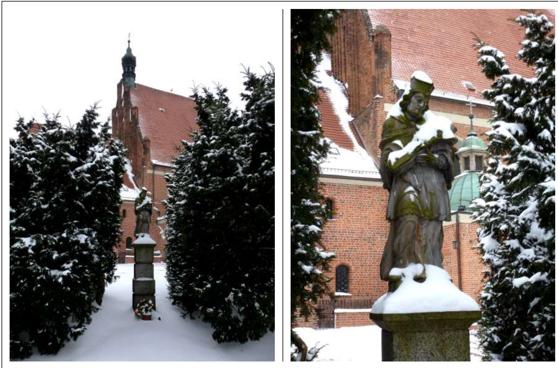
Bydgoski Jan Nepomucen z I poł. XVIII wieku (notowany w 1745). Niewielka figurka z piaskowca stoi na przykościelnym placu między farą (dziś katedra) a Brdą. Mój ulubiony nepomuczek.