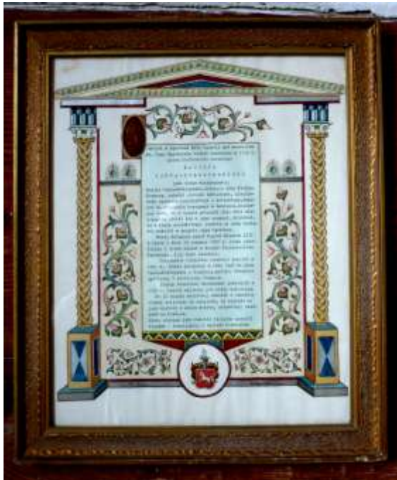
Kościół w Dąbrówce koło Tucholi pod wezwaniem św. Jana Nepomucena został fundowany w 1766 r. przez konfederata barskiego MACIEJA JANTA-POŁCZYŃSKIEGO jako votum wdzięczności.