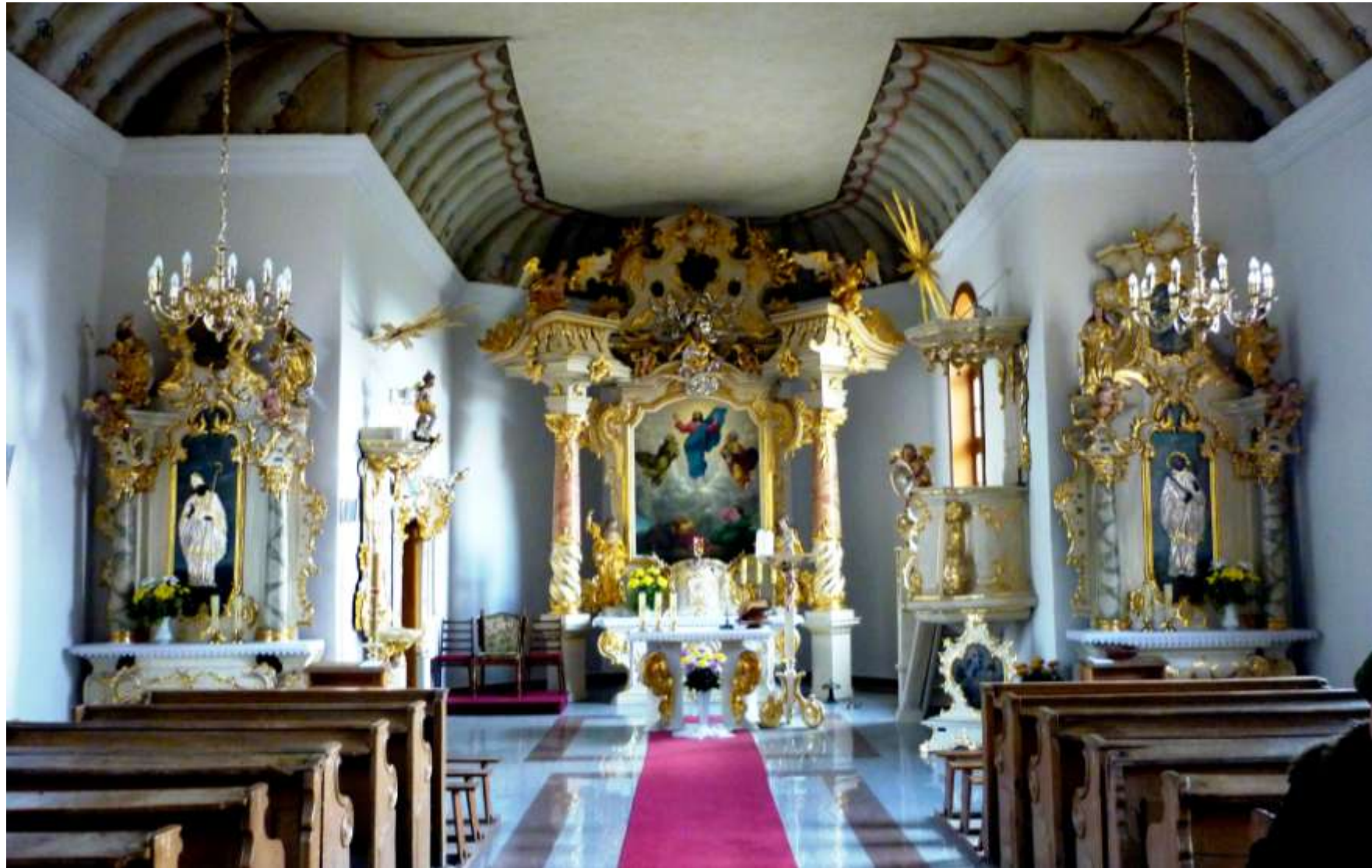
Przepiękne rokokowe wnętrze kościoła Jana Nepomucena w Dąbrówce. Patron kościoła w prawym ołtarzu bocznym. Ponadto w kościele jest feretron z Janem Nepomucenem, częściowo widoczny na zdjęciu, w pobliżu ambony. Ołtarz i feretron pokazują dokładnie na dwóch następnych kartkach.