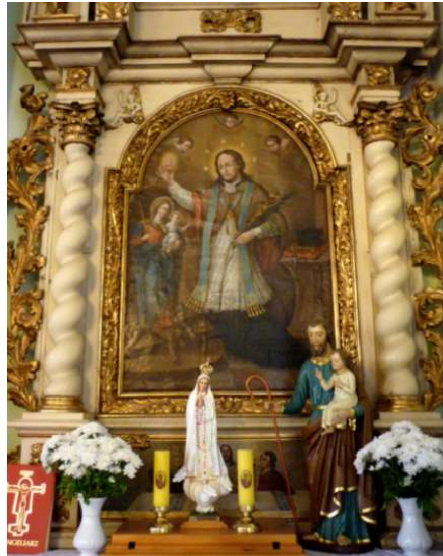
Neoromański kościół z lat 1841-42 z neogotycką wieżą dobudowaną w 1861. W prawym bocznym ołtarzu, pochodzącym z rozebranego w 1835 kościoła w Świętem, mamy obraz Jana Nepomucena z prawie pełnym zestawem swoich atrybutów –język, krzyż, palma, pięć gwiazd, pelerynka, stuła, biret, księga, klucze.