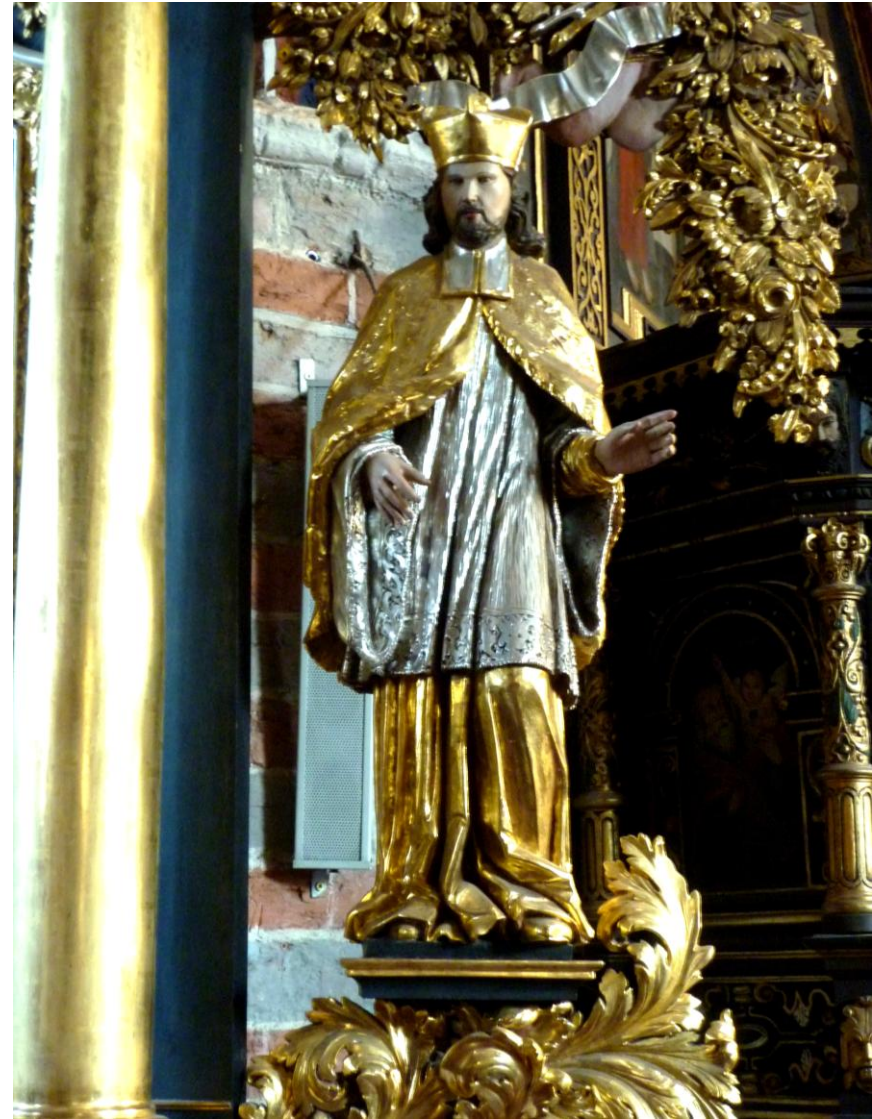
Ołtarz św. Tomasza z I poł. XVIII w XIV-wiecznej bazylice św. Tomasza. Z prawej strony figura Jana Nepomucena.