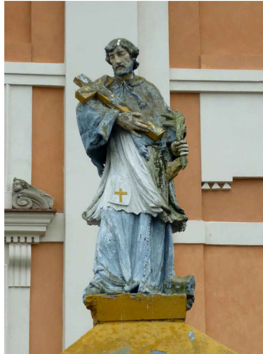
Kościół klasycystyczny Wniebowzięcia NMP z lat 1803-14, na bramie figura Jana Nepomucena