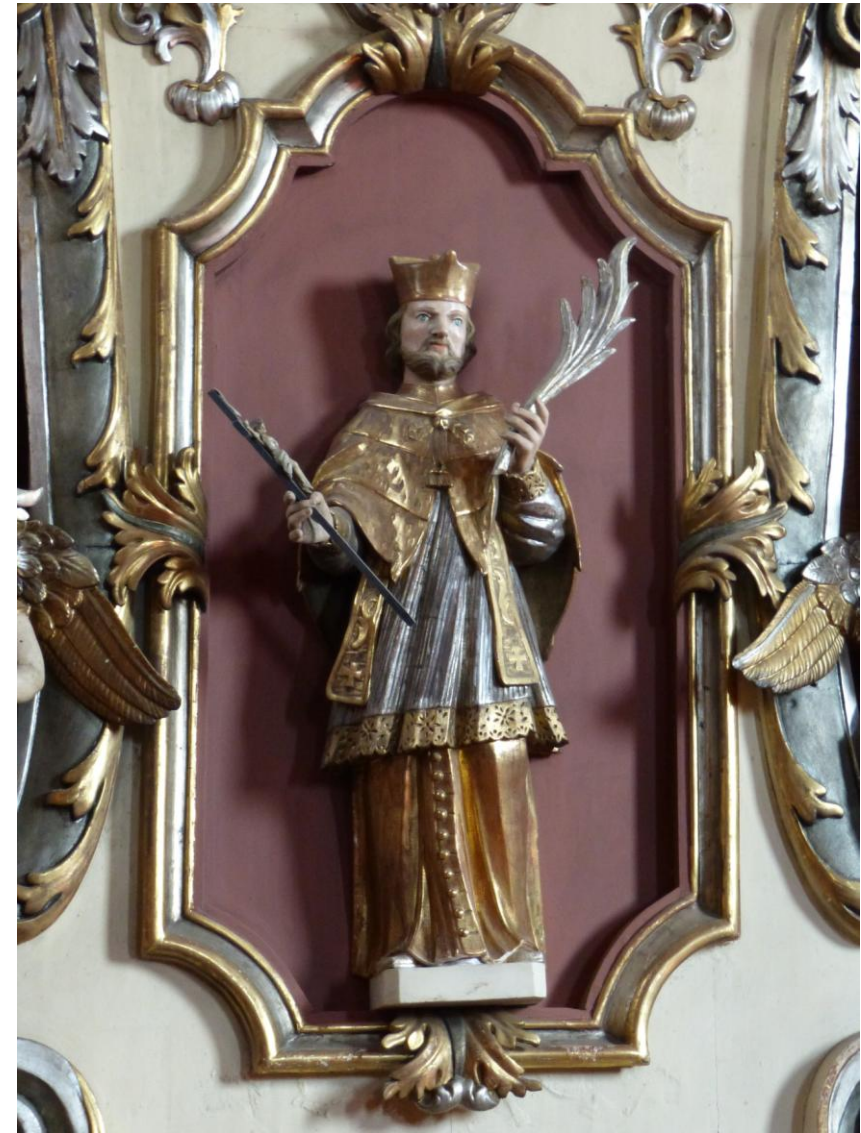
Kościół drewniany św. Wawrzyńca z roku 1761; Jan Nepomucen w środkowym polu lewego ołtarza