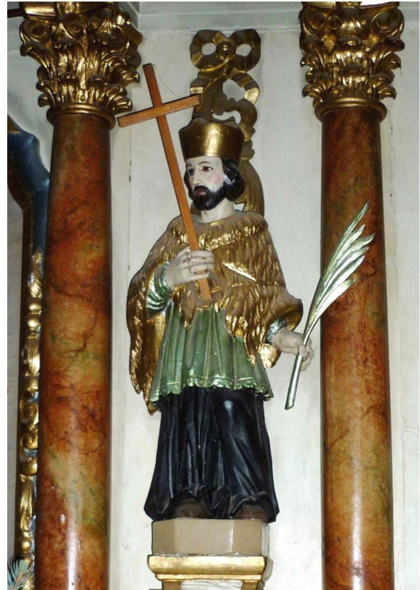
Kościół św. Bartłomieja z 1330 – ołtarz w lewym ramieniu transeptu – z prawej Jan Nepomucen