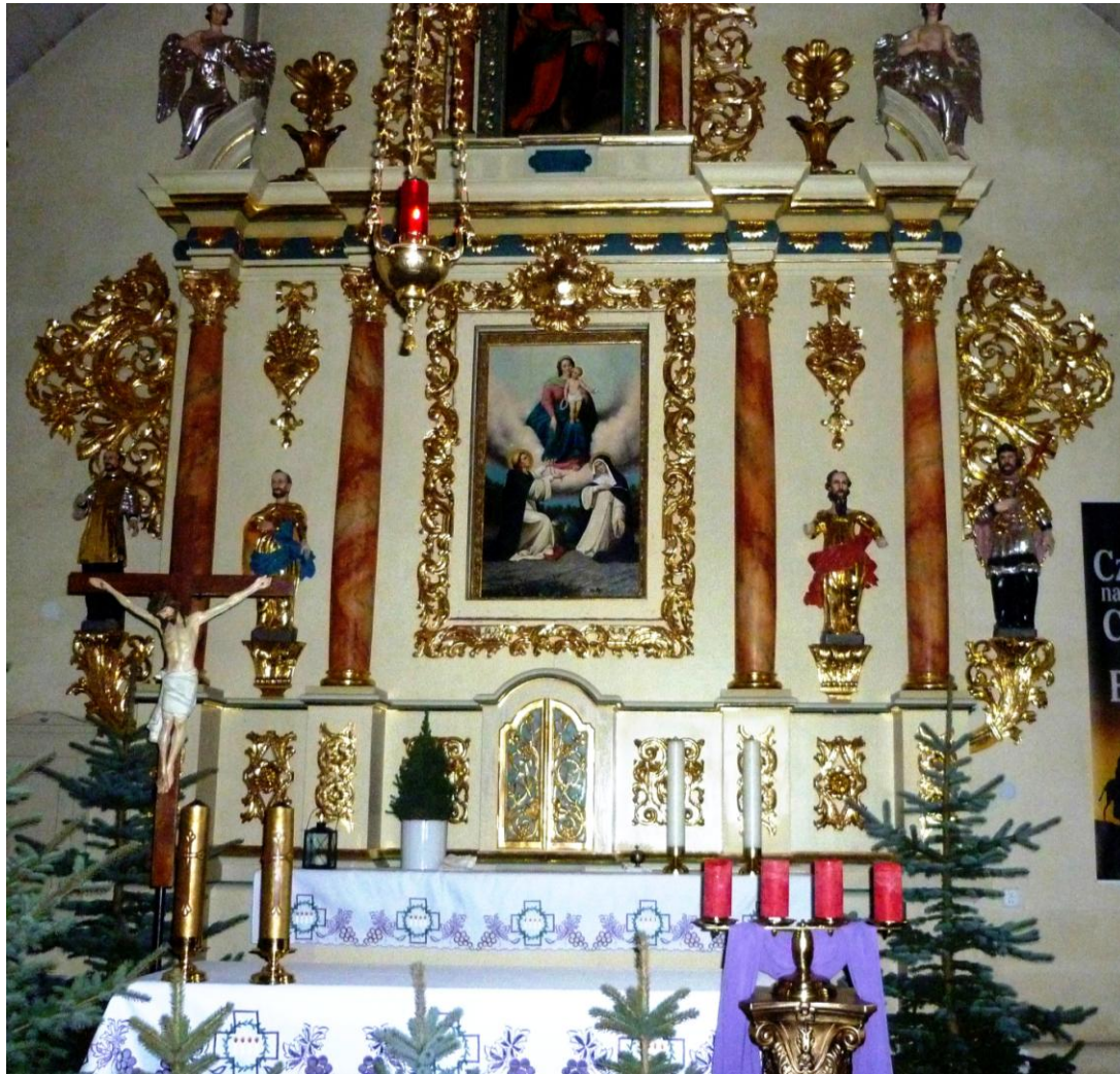
Ołtarz główny w gotyckim kościele św. Bartłomieja z roku 1330; figura Jana Nepomucena z prawej strony ołtarza.