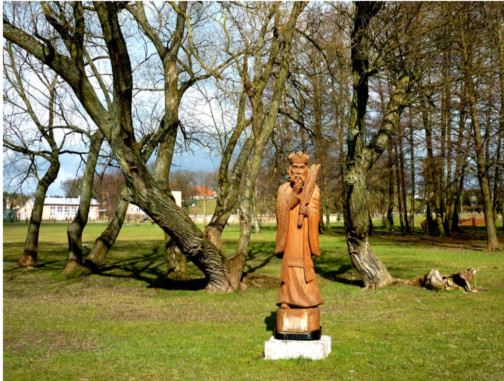
Drewniany Jan Nepomucen nad jeziorem Lidzbarskim; rzeźba Edmunda Szpanowskiego z roku 2011