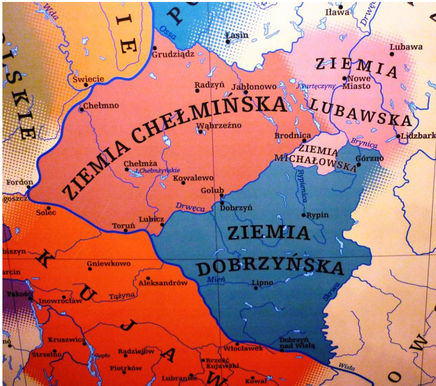
Mapa z Muzeum Etnograficznego w Toruniu

Ziemia Lubawska to niewielka kraina historyczna, dziś leżąca całkowicie w woj. warmińsko-mazurskim. Dokładniej, tworzą ją: cały pow. nowomiejski ze stolicą w Nowym Mieście Lubawskim, gm. Lubawa w pow. iławskim i dwie gminy pow. działdowskiego – Lidzbark (bez pd-wsch wypustki w Mazowsze) i Rybno.