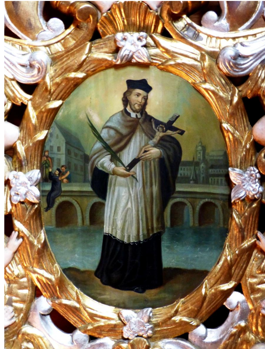
Feretron z obrazem Jana Nepomucena w drewnianym kościele św. Wawrzyńca z roku 1761