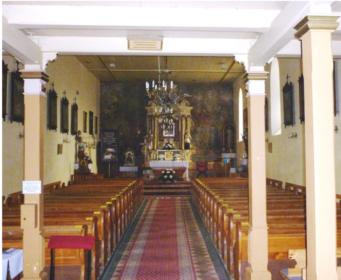
Kościół gotycki św. Katarzyny Aleksandryjskiej z XIV wieku; figura Jana Nepomucena z prawej strony ołtarza głównego.