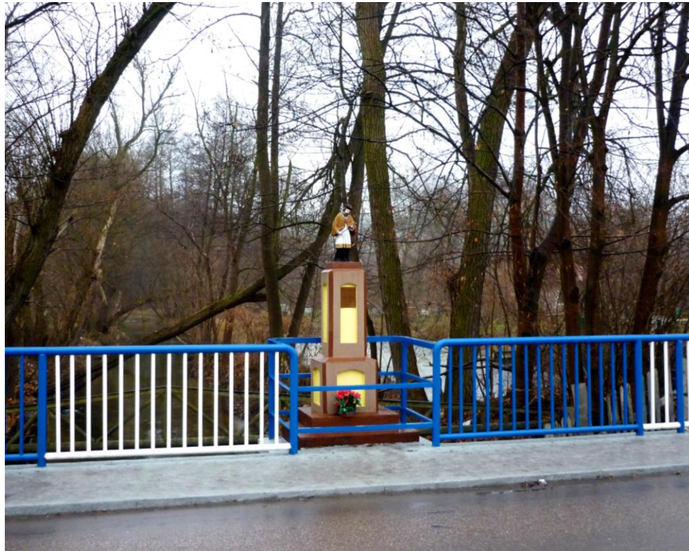
Figura Jana Nepomucena na moście na rzece Wel