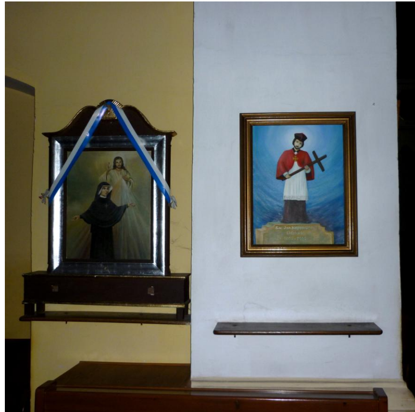
W kościele św. Wojciecha obraz, przedstawiający figurę Jana Nepomucena z mostu na rzece Wel, namalowany dla uczczenia 200-lecia tej figury.