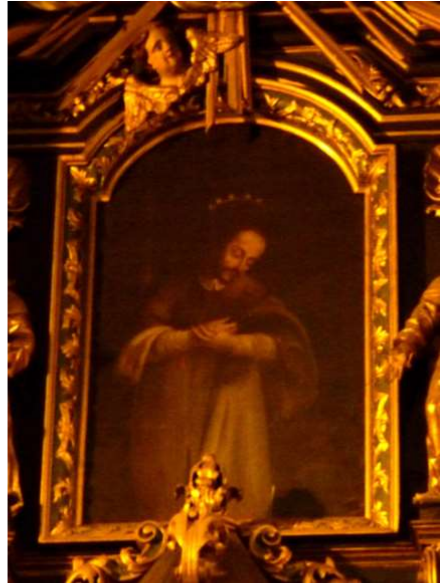
Jan Nepomucen w zwieńczeniu ołtarza głównego