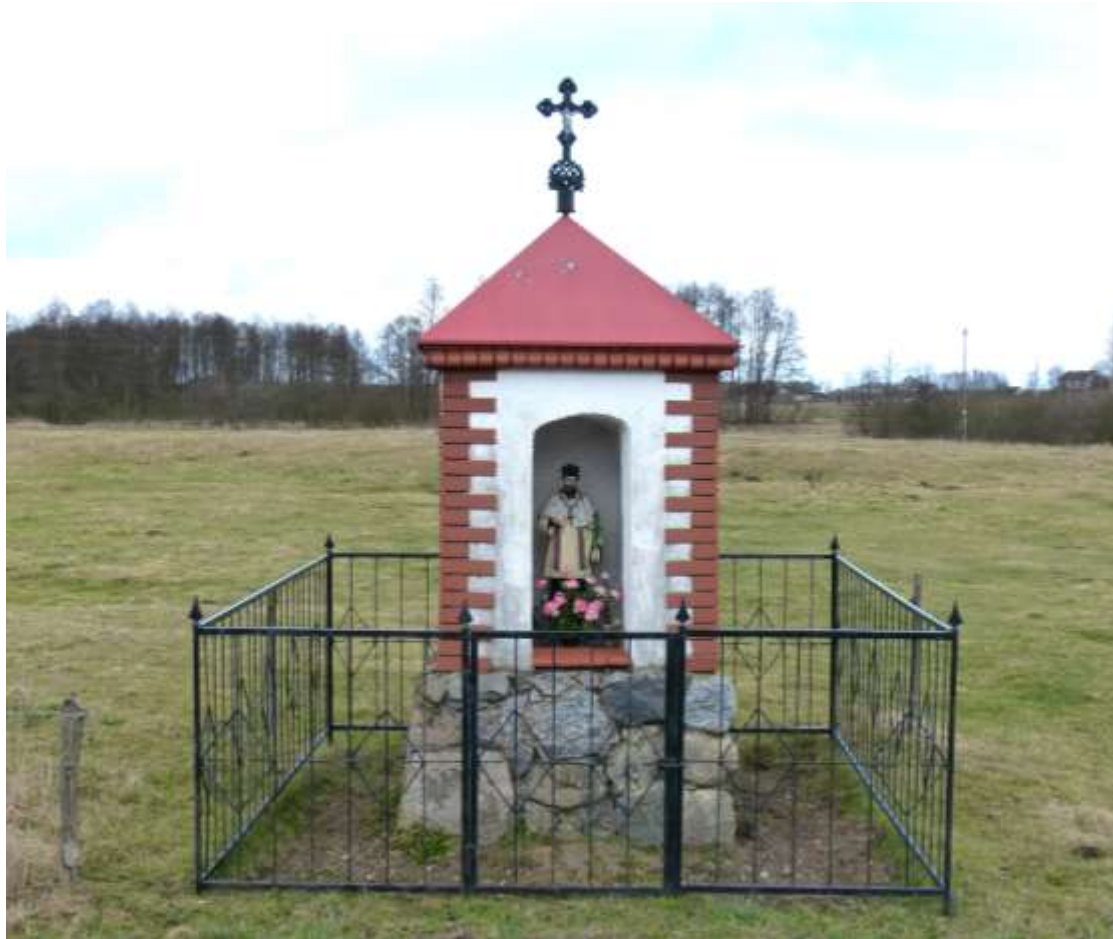
Jan Nepomucen w przydrożnej kapliczce, kilkaset metrów na zachód od wsi Zabiele