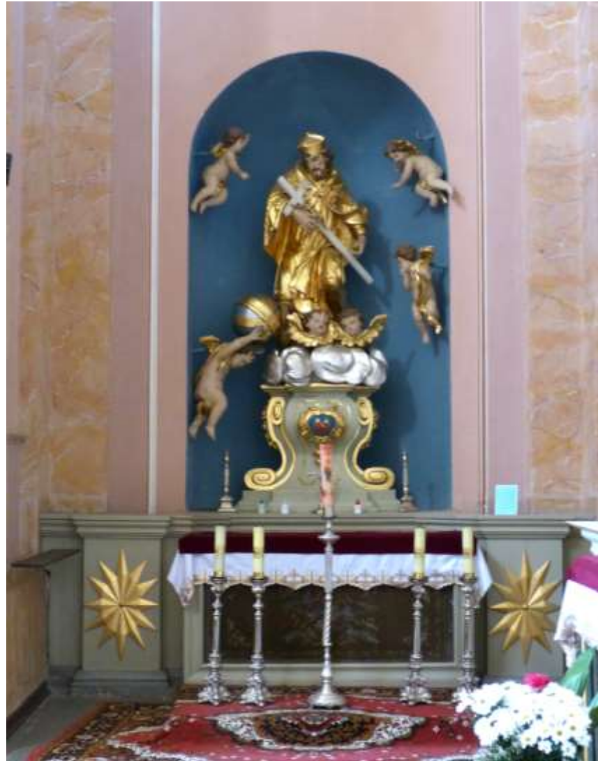
Barokowy kościół popijarski NMP z lat 1701-07; ołtarz Jana Nepomucena zamyka prawą nawę.