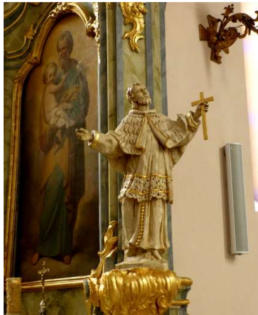
Figura Jana Nepomucena z prawej strony ołtarza św. Józefa przy czwartym lewym filarze