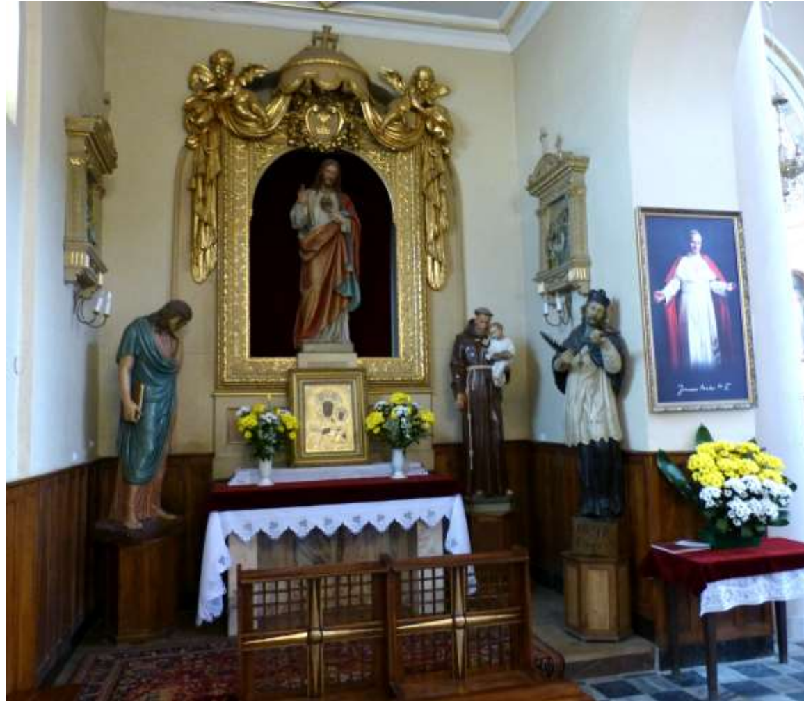
Neoklasycyński kościół Trójcy Przenajświętszej z lat 1823-24. W lewej nawie ołtarz Jezusa otoczony figurami świętych, wśród których zabytkowa drewniana rzeźba Jana Nepomucena z roku 1842.