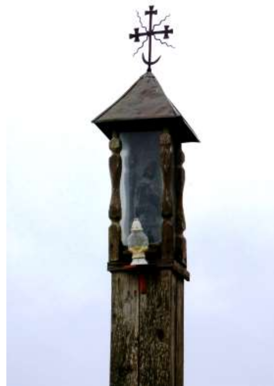
Kapliczka słupowa Jana Nepomucena przy mostku i rozstaju dróg