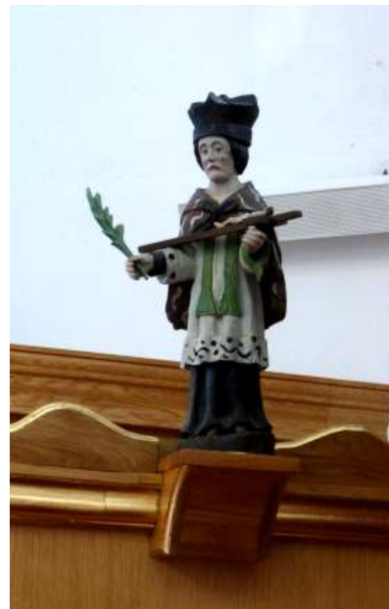
Figurka Jana Nepomucena w kaplicy MB Studzienicznej na wyspie