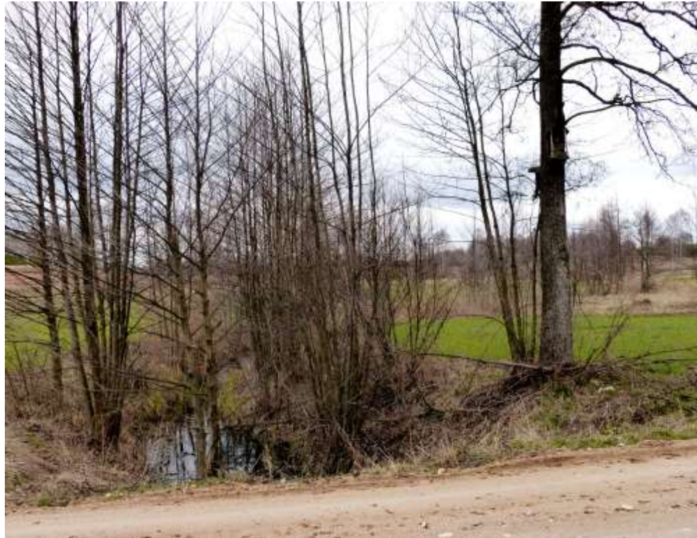
Wioska przy granicy z Litwą; na drzewie rosnącym przy skrzyżowaniu drogi ze strugą mała drewniana kapliczka z mocno zniszczoną figurką Jana Nepomucena