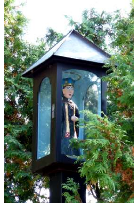
Kapliczka słupowa Jana Nepomucena przy Kanale Augustowskim