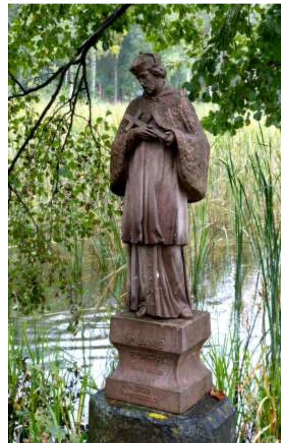
Pomnik Jana Nepomucena nad jeziorem Studzienicznym; na cokole napis: Św. Janie / Nepomucenie / Broń nas od / niesławy / w życiu / i w wieczności