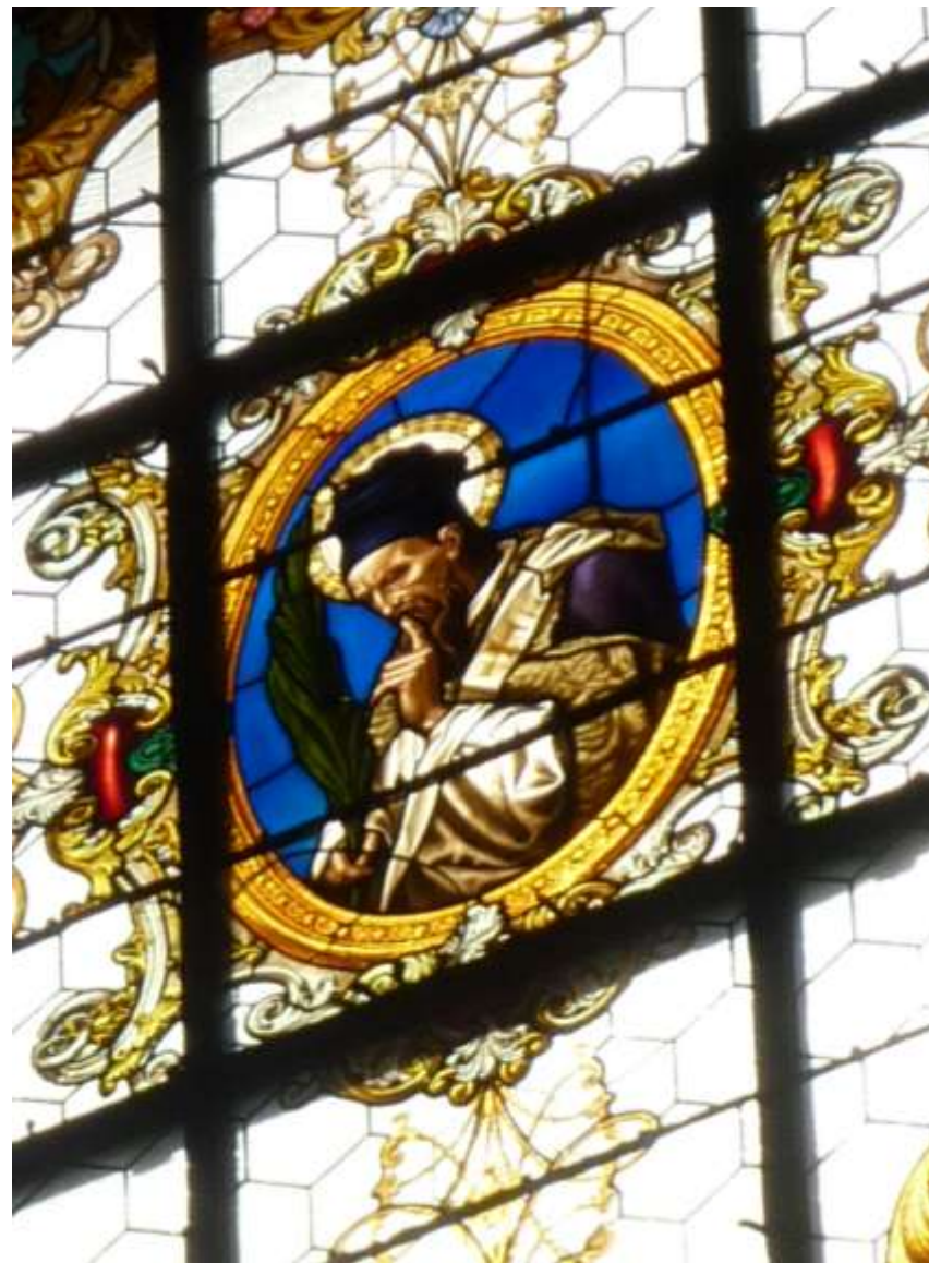
Witraż w barokowym kościele p.w. Wniebowzięcia NMP z 1724 na placu Riegra (Riegrovo náměstí)