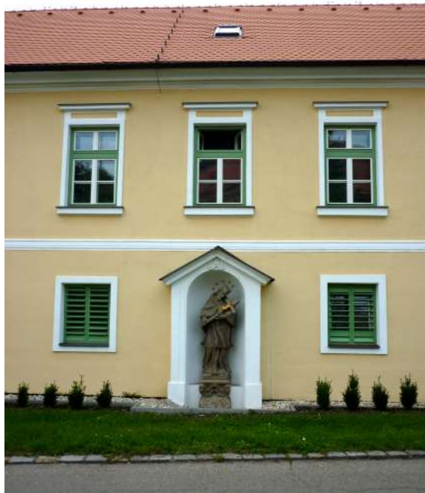
Figura Jana Nepomucena na placu dr Benesa