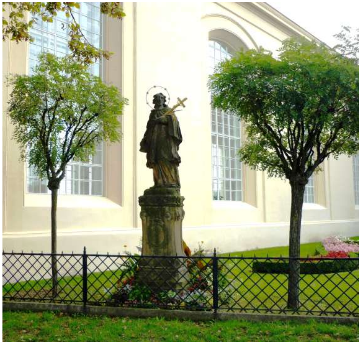
Pomnik Jana Nepomucena przed wejściem na teren Ogrodu Kwiatowego (Květná Zahrada 1665-75, 1840-45, 2012-14)