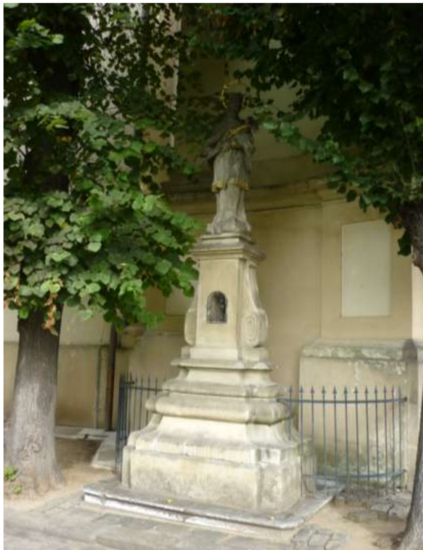
Pomník JN obok kościoła Jana Chrzciciela na placu Masaryka (Masarykovo náměstí)