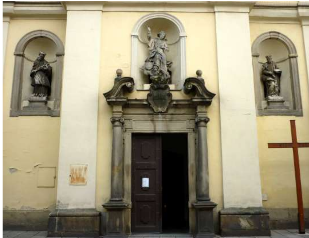
Barokowy kościół z początku XVII wieku, postawiony na gotyckich fundamentach poprzedniego kościoła. W lewej wnęce fasady figura Jana Nepomucena.