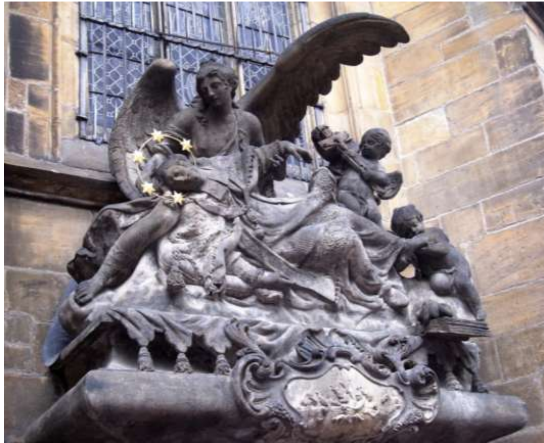
Kamienna grupa rzeźbiarska z roku 1763 przed katedrą św. Wita – zwłoki Jana Nepomucena podtrzymywane przez anioła i putta