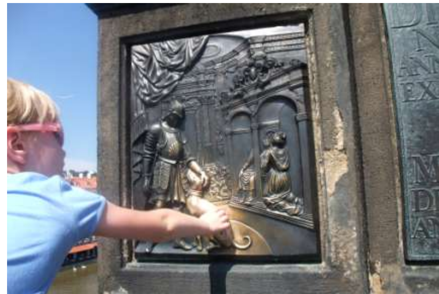
Wyżej: pierwszy pomnik Jana Nepomucena z 1683; Z prawej u góry: miejsce wrzucenia JN do Wełtawy; Z prawej u dołu: lewa płaskorzeźba na pomniku JN z 1683.