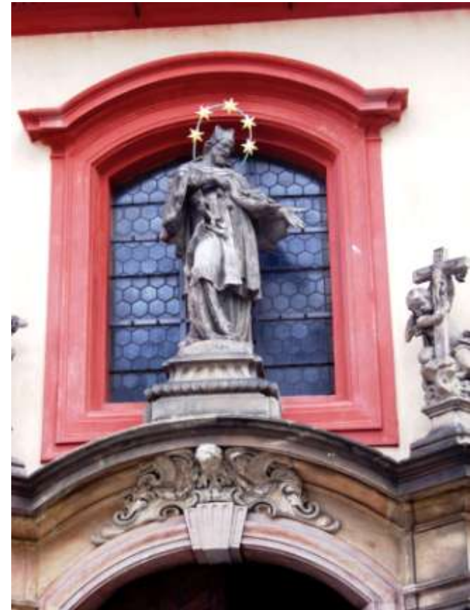
Figura Jana N. nad wejściem do kaplicy JN przy kościele św. Jerzego (pocz. XVIII w.)