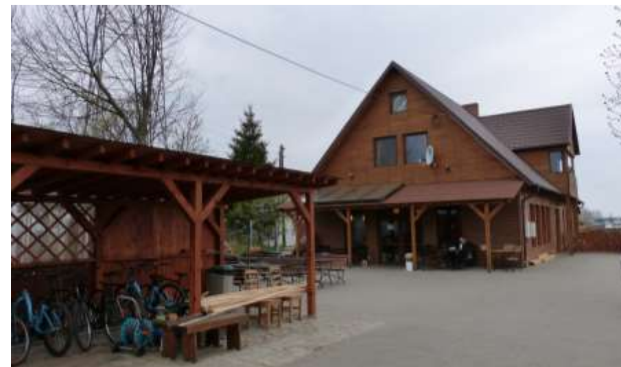
Karczma Ptasi Raj