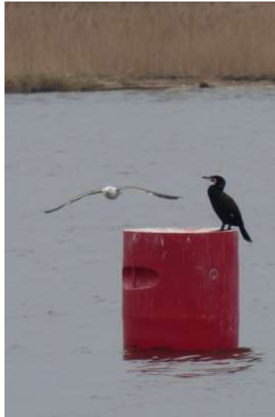
kormoran i mewa srebrzysta