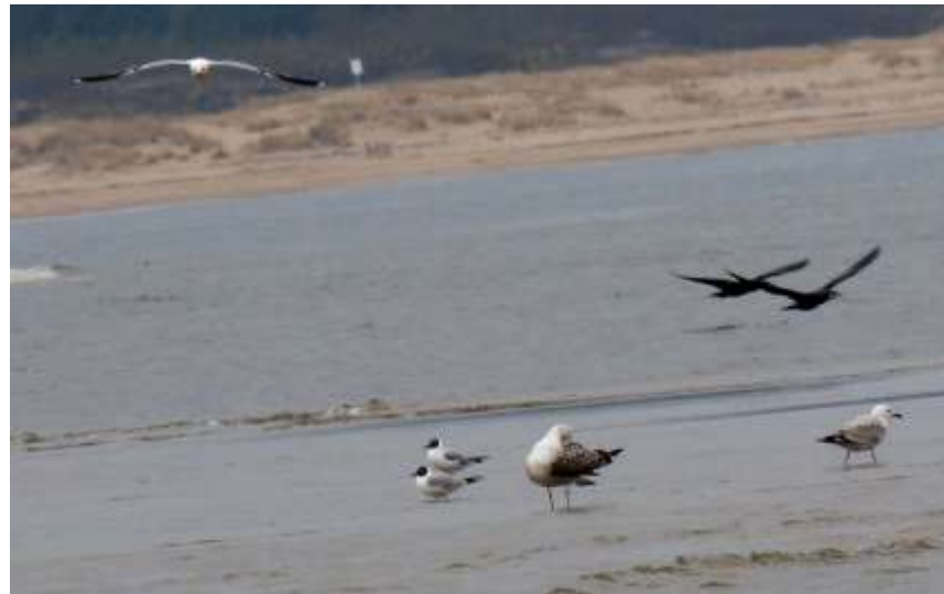
śmieszki, srebrzysta i siwa, wyżej siodłata i kormorany