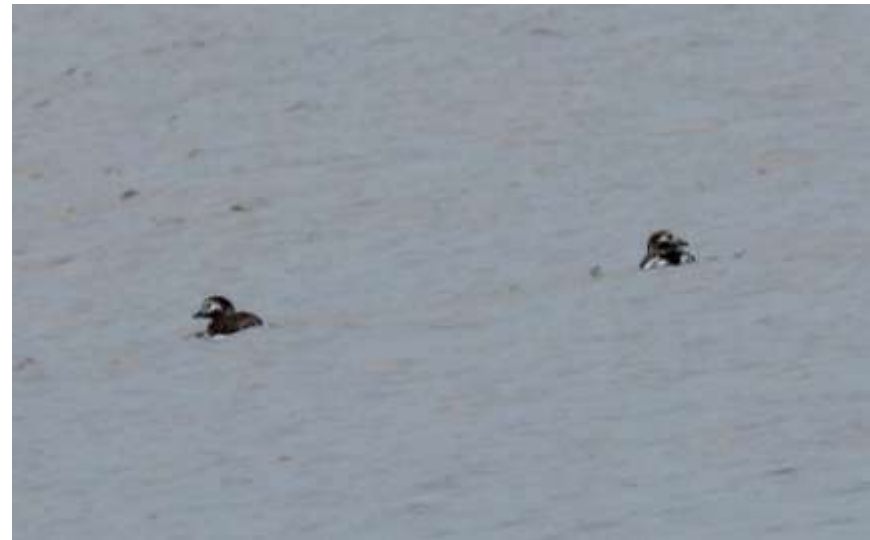
myślałem, że lodówki już odleciały