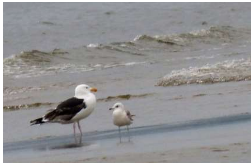
siobłata i siwa