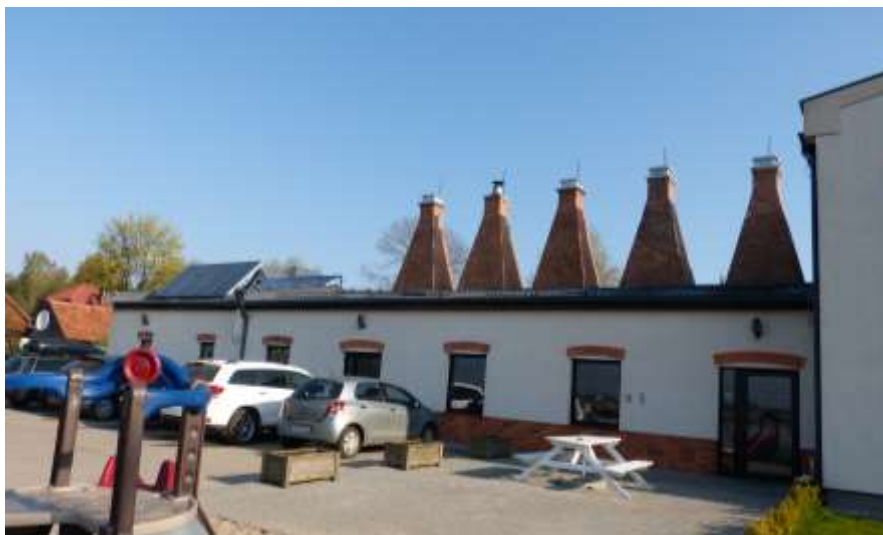
Pensjonat Stara Wędzarnia