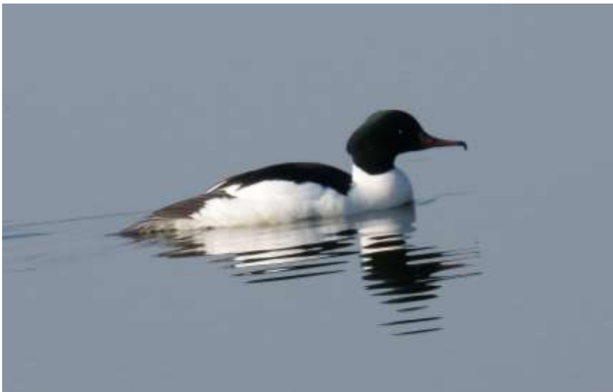
to jeden z nich, drugi uciekł