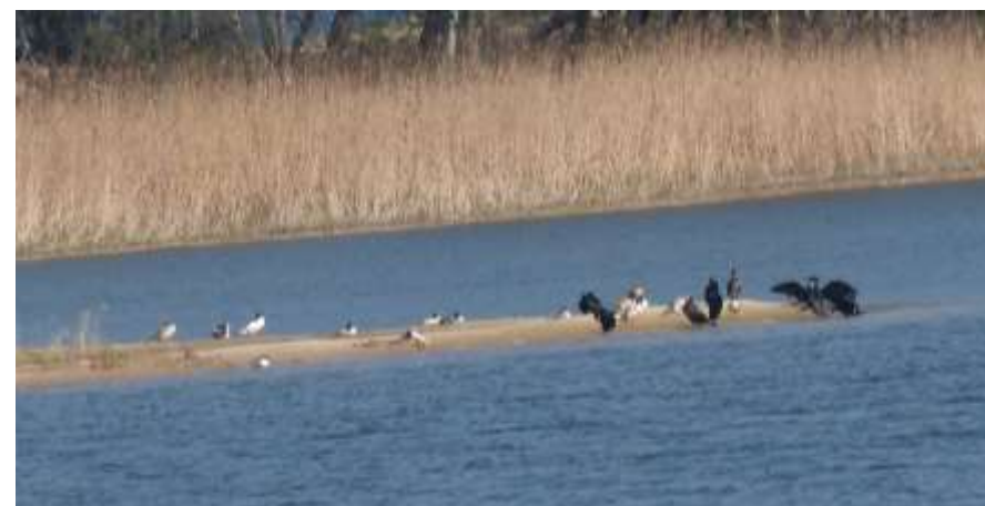
Spojrzenie z wieży widokowej