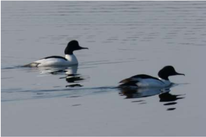
przyleciały dwa nowe