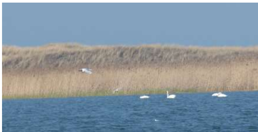
Spojrzenie z grobli

Rezerwat Ptasi Raj leży na zachodnim krańcu Wyspy Sobieszewskiej, przy ujściu Wisły Śmiałej, od której oddziela go kamienna grobla między rzeką a jeziorem. Ciekawa ścieżka dydaktyczna z dwiema wieżami – nad jeziorkiem Karaś i nad jeziorem Ptasi Raj, głównym obiektem rezerwatu. W sobotę 19 kwietnia przeszliśmy kawałek grobli, następnego dnia ścieżką przez las do Karasia i Ptasiego Raju i z powrotem. Z ptakami słabo, może nad zatoką lepiej, ale nie doszliśmy tym razem.