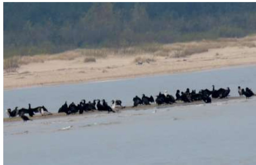
wielka banda kormoranów