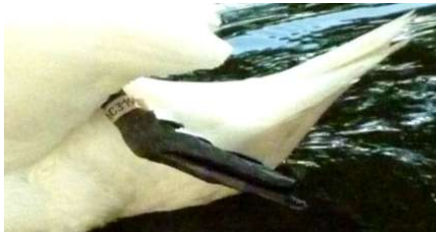
...C319... na lewej nodze

Tomaszów Maz., rez. Niebieskie Źródła, 6 czerwca 2014