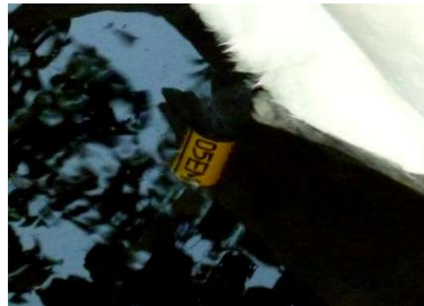
05EM na prawej nodze