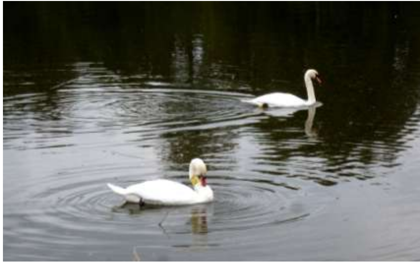
Stawy Raszyńskie, 8 października 2013